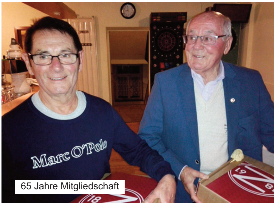
65 Jahre Mitgliedschaft