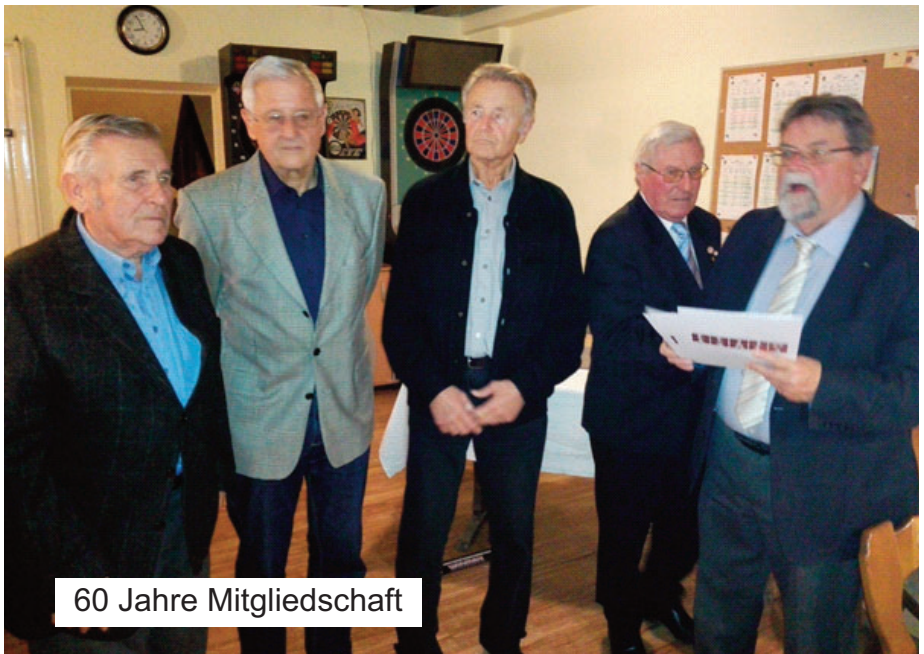
60 Jahre Mitgliedschaft