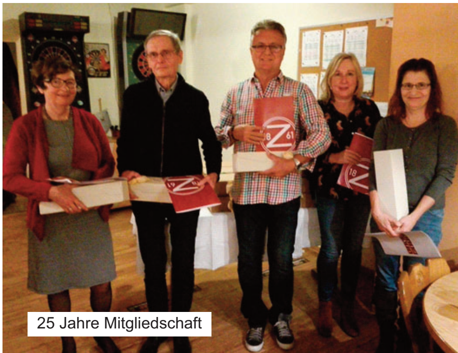
25 Jahre Mitgliedschaft