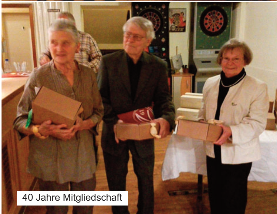
40 Jahre Mitgliedschaft