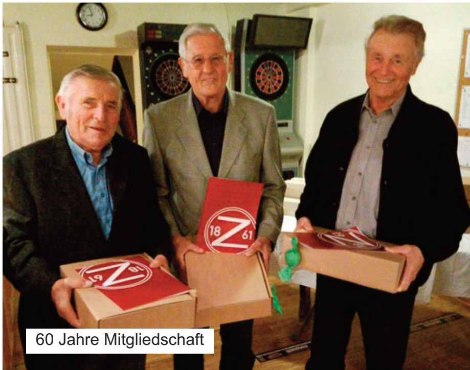
60 Jahre Mitgliedschaft