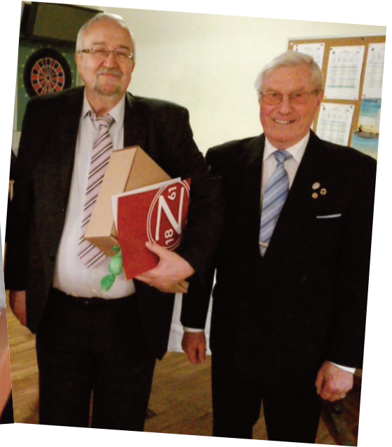
50 Jahre Mitgliedschaft