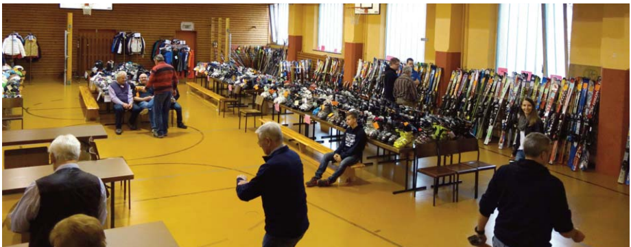
Die Ruhe vor dem ...

Am Sonntag Mittag versammelte sich wieder die Schar der Helfer, und gegen 13 Uhr wurden die Türen geöffnet, um die Wartenden einzulassen. Die erfahrenen Einkäufer erschienen gleich zu Anfang, denn – nur wer zuerst kommt, hat die beste Auswahl! Trotz des Regenwetters kamen wieder mehr Besucher als im Vorjahr, wobei die Zahlen früherer Jahre nicht mehr erreicht werden. Ob es wohl daran lag, dass unser Skibasar auf das Ende der Herbstferien fiel und auch die „Consumenta“ noch geöffnet hatte?