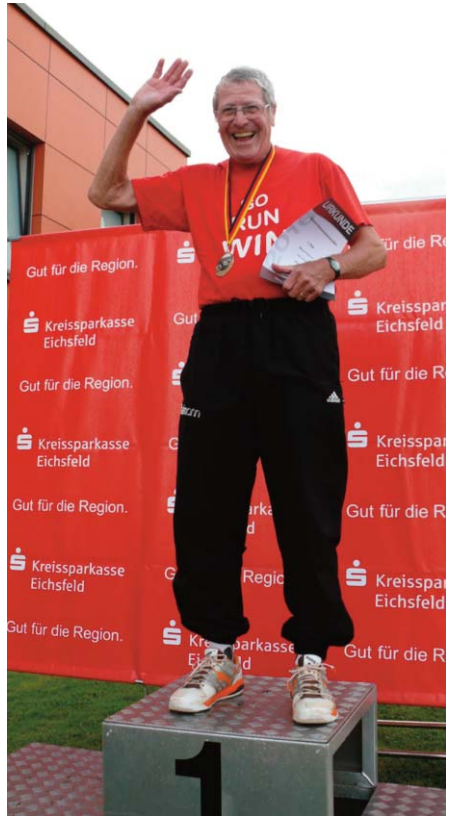
Deutscher Meister 2016 im Hochsprung

Weil er schon mal da war, hat er natürlich auch noch beim Diskuswerfen mitgemacht und ist mit 24,27 m Achter geworden, den Hammer hat er 30,55 m weit geworfen und ist damit auf Platz sieben gelandet. Ist doch auch was.