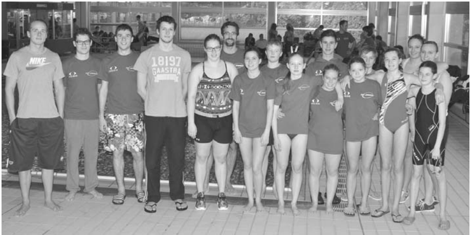
Das Damen- und Herrenschwimmteam bei der deutschen Mannschaftsmeisterschaft

Erstmals in der Vereinsgeschichte nahm der TSV Zirndorf beim Bezirksdurchgang der deutschen Mannschaftsmeisterschaft (DMS) mit einer Damen- und einem Herrenteam teil. Dabei galt es alle olympischen Strecken einschließlich solcher Hammerstrecken wie 200m Schmetterling 400m Lagen und 1500 Freistil zu absolvieren. Jeder Schwimmer durfte nur höchstens vier Mal an den Start gehen, aber jede Strecke mußte zweimal pro Mannschaft besetzt werden.