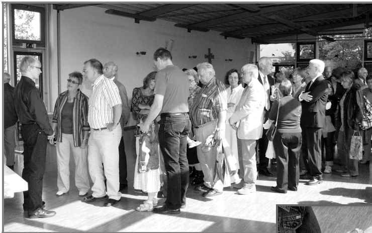
Ein fast nicht enden wollendes Defilee von Pfarrmit- gliedern, die sich bedanken und gute Wünsche mitgeben