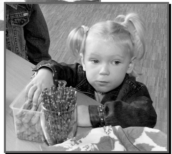
Die Kleinen vertreiben sich inzwischen die Zeit auf ihre Weise.