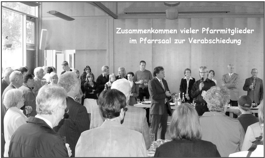
Zusammenkommen vieler Pfarrmitglieder im Pfarrsaal zur Verabschiedung