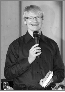
Ministranten, Jugend und Jugendchor bedanken sich für die intensive Begleitung und Führung.